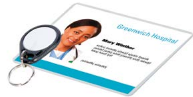
RFID-Karte und RFID-Tag

Das KT Touch hat die RFID-Funktion standardmäßig integriert. Das berührungslose Aktivieren der Anwesenheit erhöht den Schutz gegen Infektionen. Alle Aktivitäten können zur späteren Auswertung protokolliert werden.