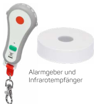
Alarmgeber und Infrarotempfänger