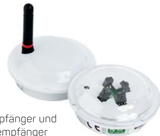
Funkempfänger und Infrarotempfänger

Die Empfänger des Echtzeit-Lokalisierungssystems (RTLS) können direkt an das KT Touch angeschlossen werden. Durch diese Integration werden die Zusatzkosten für ein separates RTLS-Netzwerk eingespart.