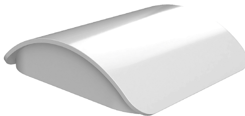
Abb. 1: Alarmindikator alaro AI19L

Dank einem schlichten Design überzeugt der Alarmindikator alaro AI19L besonders Architekten und Planer, welche Wert auf die Ästhetik legen. Somit können Sie Ihren Kunden eine schöne und funktionale Alternative für optisch anspruchsvollere Bauten bieten.